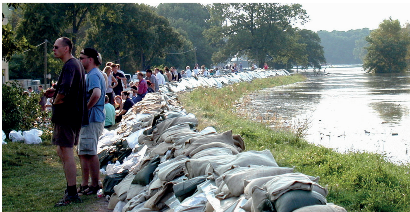
Protection traditionnelle contre les inondations. DESSAU, 2002, DE, Thomas Hartmann