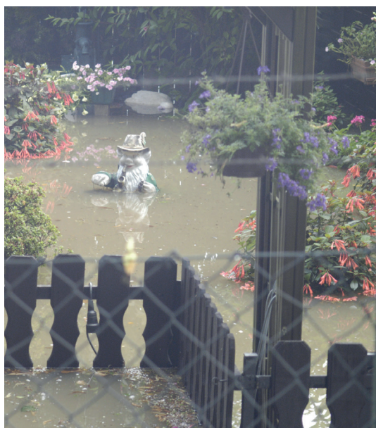
Inondations le long de la rivière Ruhr. SCHWERTE, 2008, DE, Uwe Gruetzner (TU Dortmund)

Les conditions techniques et hydrologiques de ces orientations sont bien connues, mais elles nécessitent toutes davantage de foncier que les mesures traditionnelles. Les terrains sont déjà utilisés à d'autres fins et sont souvent privés. Le problème est d'intervenir sur les usages de ces terrains – en propriété individuelle ou collective. La mobilisation de terrains privés pour le stockage temporaire des inondations nécessite une coordination des différents acteurs et institutions en matière de gestion de l'eau, en incluant les propriétaires fonciers (individuels ou communaux) dans les plans de gestion. Ce processus compliqué, long et coûteux est souvent imaginé après-coup dans la gestion conventionnelle des risques d'inondation, qui traite généralement en premier lieu de problèmes techniques et hydrologiques. C'est un besoin essentiel en matière de rétention d'eau et de résilience aux inondations, il faut donner la priorité à la gestion du foncier.