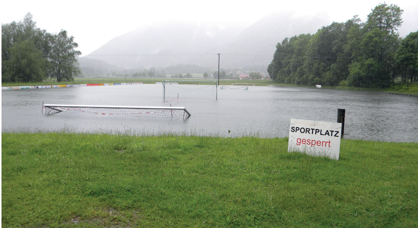
Inondations dans l'arrière pays. SCHLECHING 2013, DE, Harald Hartmann

des ajustements physiques doivent être réalisés sur des terrains privées, là où les dommages causés par les inondations sont les plus importants. Les propriétaires peuvent adopter des mesures relativement modestes et peu onéreuses pour rendre leurs logements moins vulnérables aux inondations, mais ils ne le font généralement pas faute d'une prise de conscience du risque.