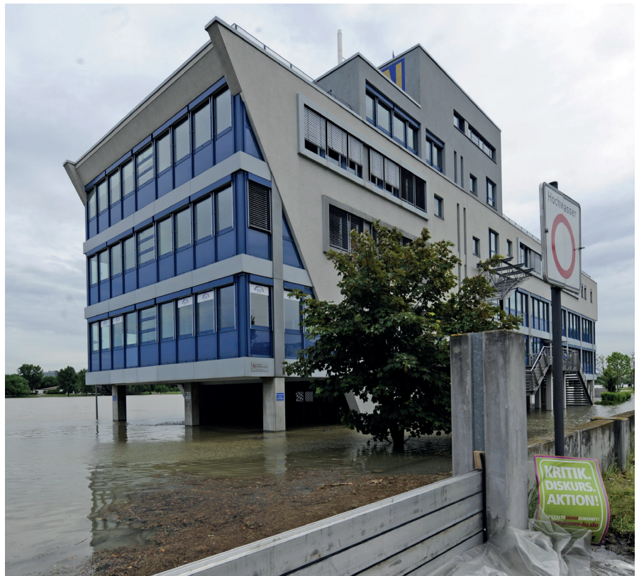
Villes résilientes LUDWIGSHAFEN, 2013, DE, Martin H. Hartmann

des dimensions sociales et culturelles de la propriété et d'autres caractéristiques propres à chaque contexte.